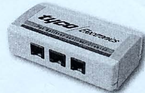
Ref Tyco: 0-0136964-1

□ Dans le cas d'une alarme utilisant le réseau téléphonique, l'utilisation d'un filtre maître est également nécessaire.