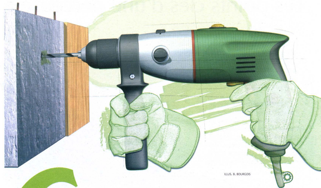
ILLUS. B. BOURGOIS

Raccordée à l'une des prises USB de votre ordinateur portable, cette clé vous permet de surfer et d'envoyer des e-mails n'importe où en France, soit avec un forfait ajustable à partir de 2 h (10 €/mois avec engagement 2 ans + 9 € la clé), soit avec un pass temporaire (par exemple, 2 h, valable 15 jours pour 14 €, 69 € la clé). Orange Internet Everywhere.