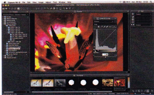
Version bêta à télécharger sur: http://beta.nikonimglib.com

Ce n'est pas une surprise, mais maintenant c'est officiel : le développement de Capture NX2 est arrêté à compter de juillet 2014. La suite de logiciels Nikon (View NX2 et Capture NX2) cède la place à un seul logiciel gratuit appelé Capture NX-D. Ce programme est en version bêta actuellement. Lorsque Capture NX-D sera officialisé, il n'y aura plus de mises à jour pour les deux logiciels sus-mentionnés.